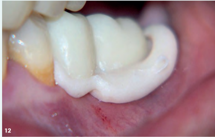
Rimozione del provvisorio ribasato che verrà poi rifinito e lucidato.

Una volta riposizionata la struttura elettrosaldata sui monconi si procede alla ribasatura diretta del provvisorio in modo da poter inglobare la struttura stessa ed ottenere quindi un manufatto rimovibile rinforzato che avrà anche il vantaggio di stabilizzare gli impianti.