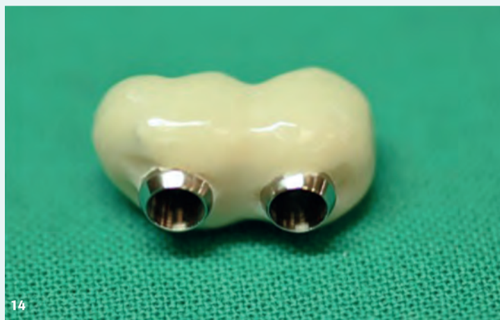
Applicazione del provvisorio "senza cemento" sfruttando le proprietà del cono morse.