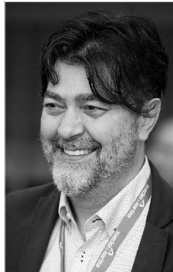
Antonello Di Felice