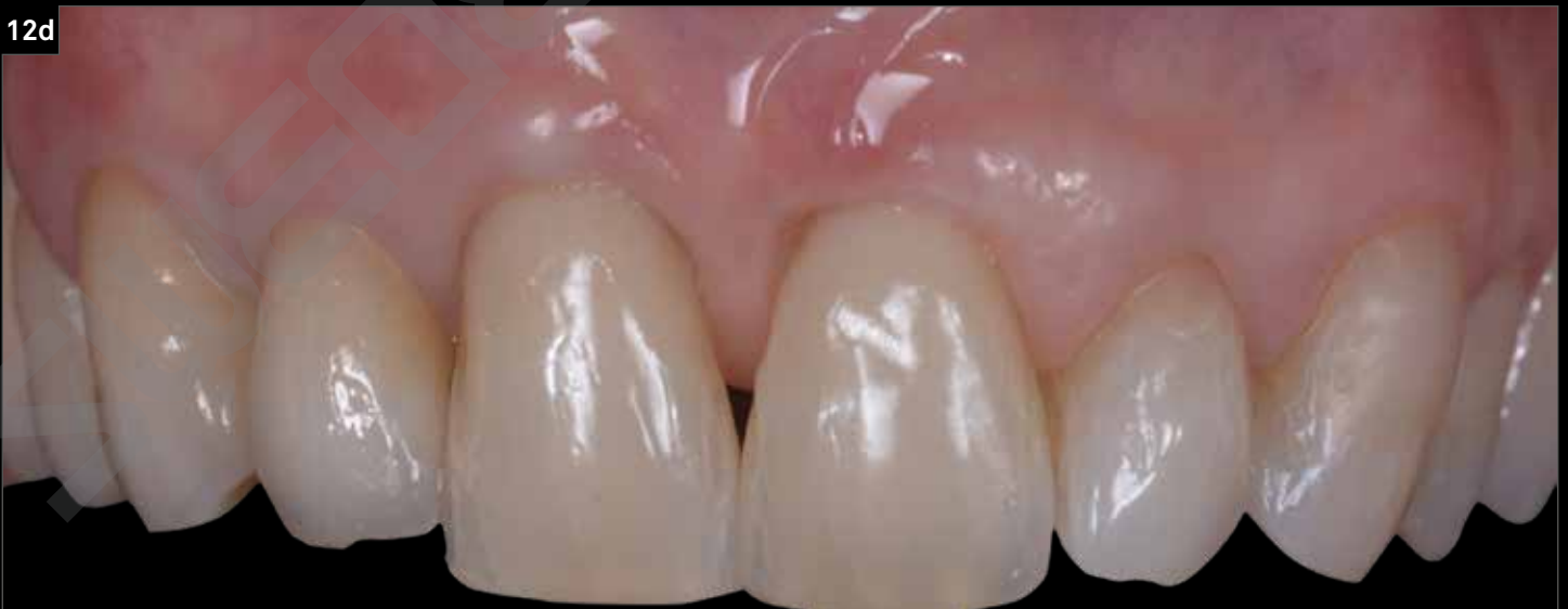
12. Cementazione della corona definitiva e aspetto generale della paziente dopo il rifacimento in zirconio-ceramica di tutte le corone e del recupero delle quinte classi sugli elementi 1.1 e 2.1.